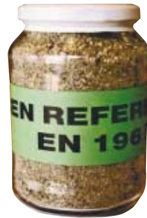
7 1350 g CEN-Referenzsand als „Urmeter für Prüfsande“ werden in Gläsern verschlossen und bei einer Mindesthaltbarkeit von 50 Jahren aufbewahrt 7 1350 g of CEN reference sand as “master standard for test sands” sealed in jars with a storage life of at least 50 years

Neben den Hauptprodukten bietet die Normensand GmbH weitere Spezialsande an. So wird beispielsweise ein Mineralprüfstaub erzeugt, der unter anderem zur Staubsauger-Eignungsprüfung eingesetzt wird. Mit dem Analyse-Siebe-Kon-